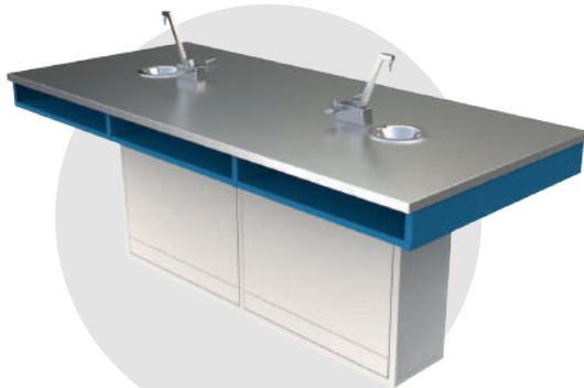
ME INOX 200