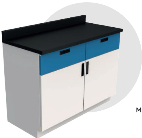
MGB 12060 MEL