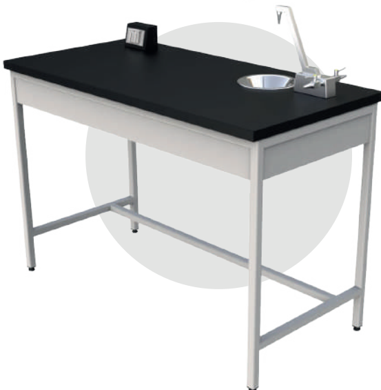
MP 1260 MEL