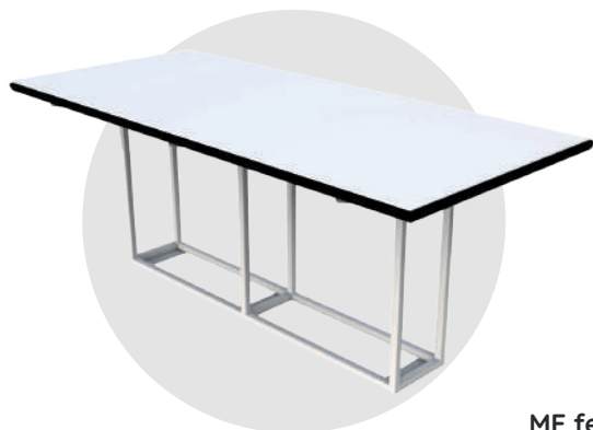
ME fen 330