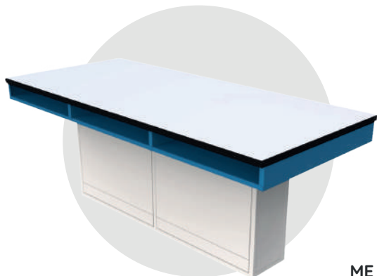
ME fen 300