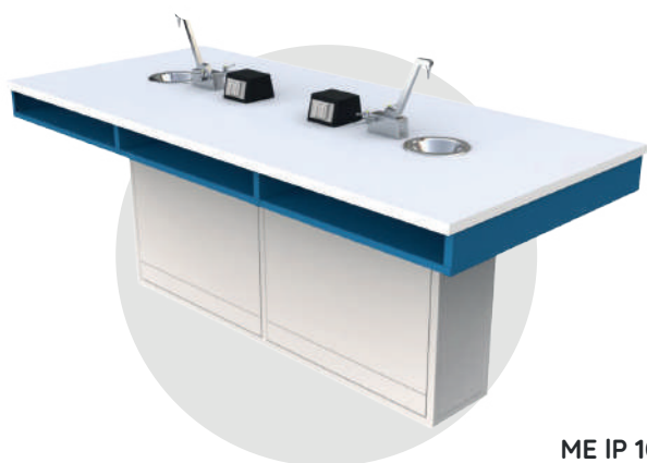
ME IP 100