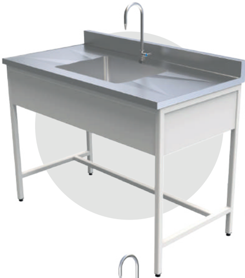
ML 1260 INOX