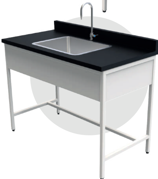
ML 1260 MEL