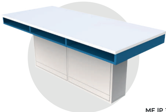
ME IP 300