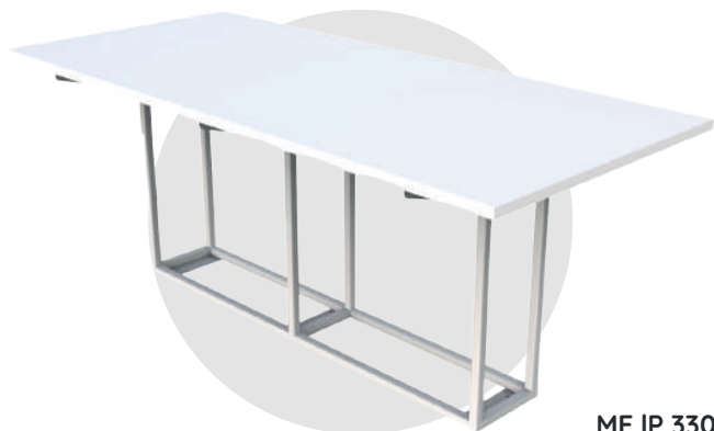
ME IP 330