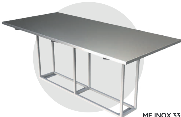
ME INOX 330