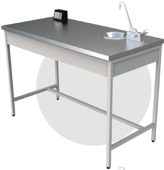
MP 1260 INOX