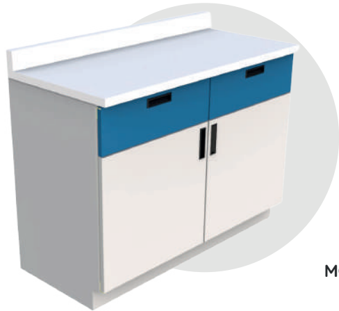
MGB 12060 LPL