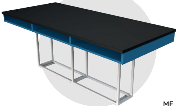
ME mel 320