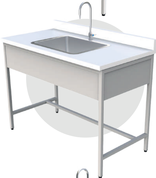
ML 1260 lp