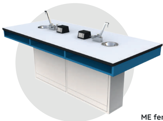
ME fen 100