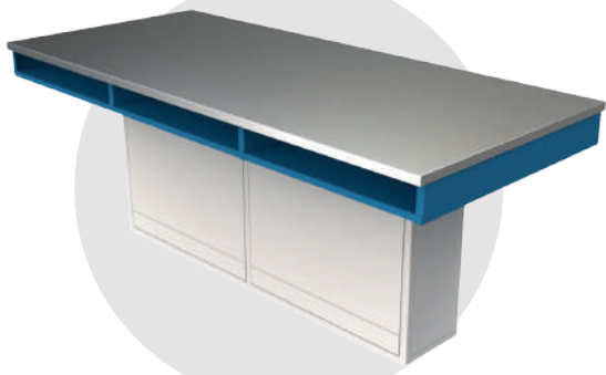
ME INOX 300