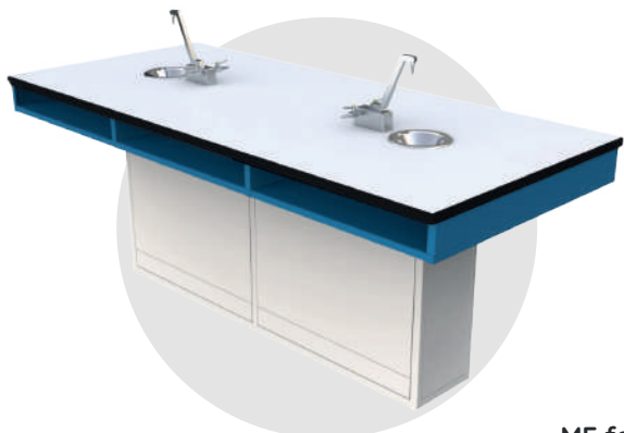
ME fen 200