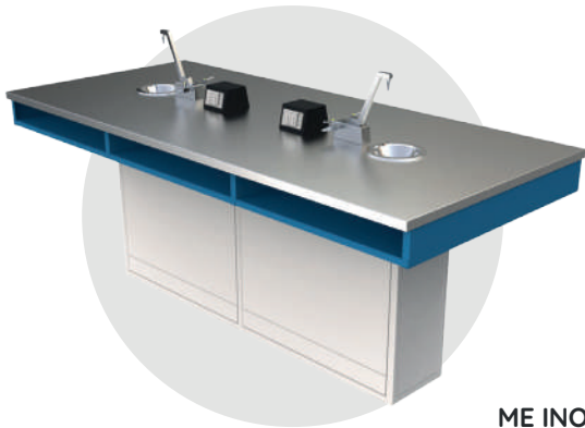
ME INOX 100