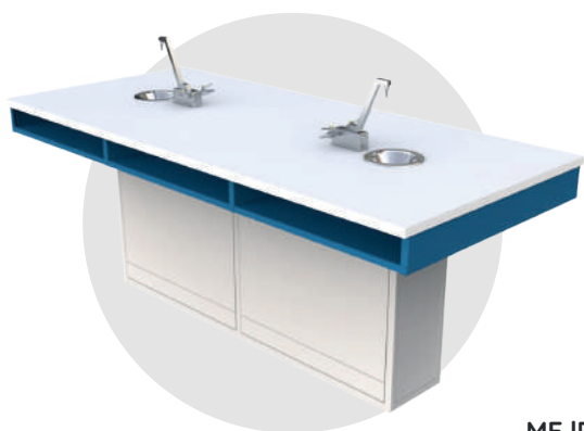
ME IP 200