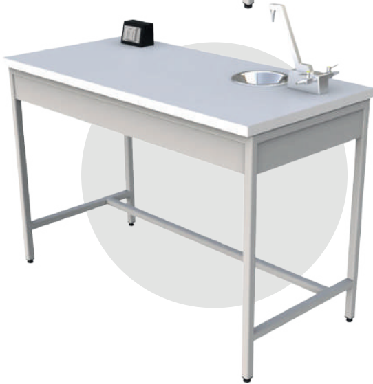
MP 1260 LP