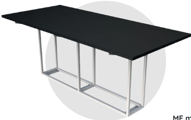
ME mel 330