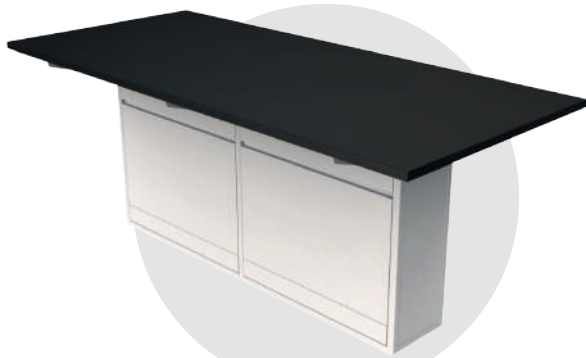
ME mel 310