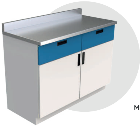
MGB 12060 INOX