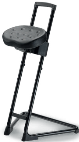
1915 Sit-Stand antifatiga

Poliuretano tipo piel integral. (color negro). Aro descansapiés en modelo alto.