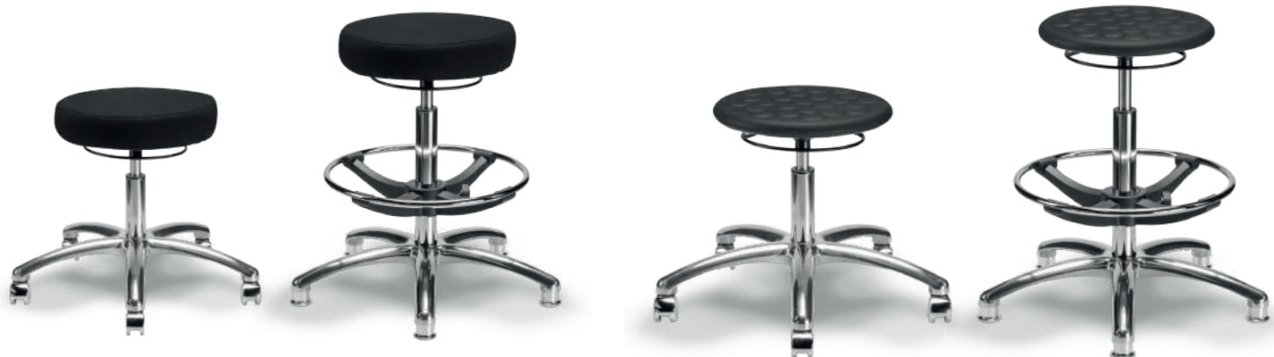
1907 B / 1907 A Banco industrial ESD

Giratoria, asiento y respaldo de poliuretano tipo piel integral (color negro), reclinable, con ajuste de altura de asiento y respaldo, aro descansapies. Coderas opcionales. Aro descansapies en modelo alto.