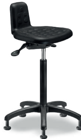
1917 A Sit-Stand antifatiga

Poliuretano tipo piel integral color negro, con giro lateral, ajustable en altura e inclinación.