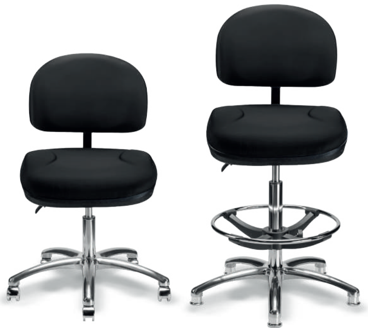
1932 B / 1932 A ESD Respaldo medio