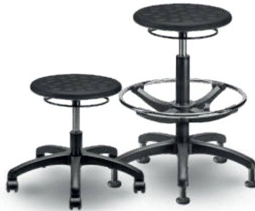
1900 B / 1900 A Banco industrial

Espuma de poliuretano tapizado altura e inclinación. en tela o vinil. Aro descansapiés en modelo alto.