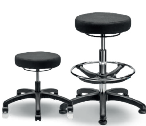
1905 B / 1905 A

Sillas de trabajo, industriales, comerciales, para laboratorio y electrostáticas ESD