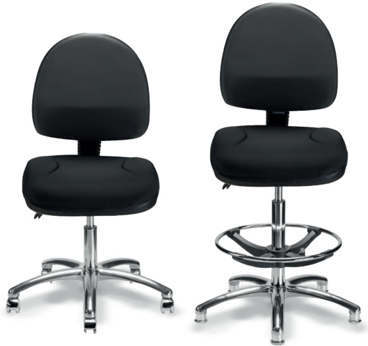
1942 B / 1942 A ESD Respaldo medio