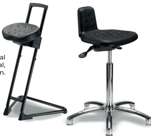
1918 A ESD Banco industrial ESD

1926 ESD Banco industrial ESD Poliuretano tipo piel integral color negro, con giro lateral, ajustable en altura e inclinación.